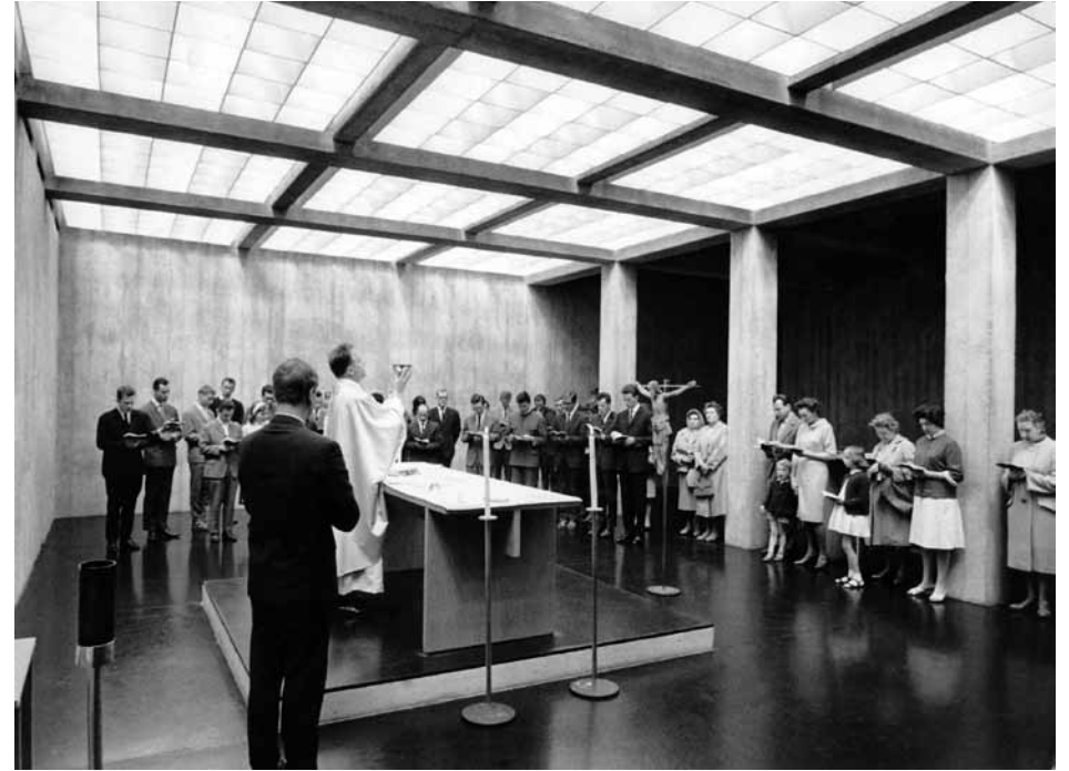
Abb. 3 – 4 Kapelle Peter Jordan-Straße, Wien 1961-63