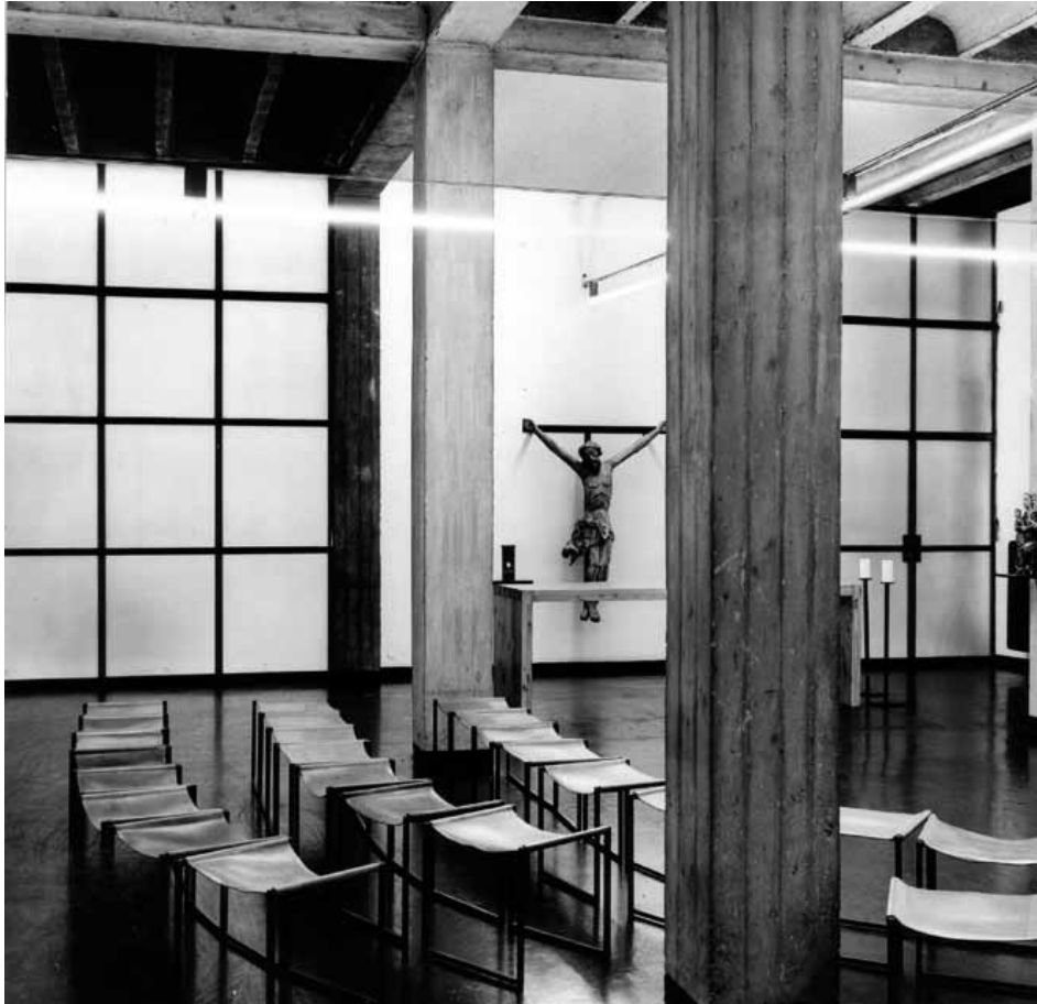
Abb. 1 Kapelle Ebendorferstraße, Wien 1958