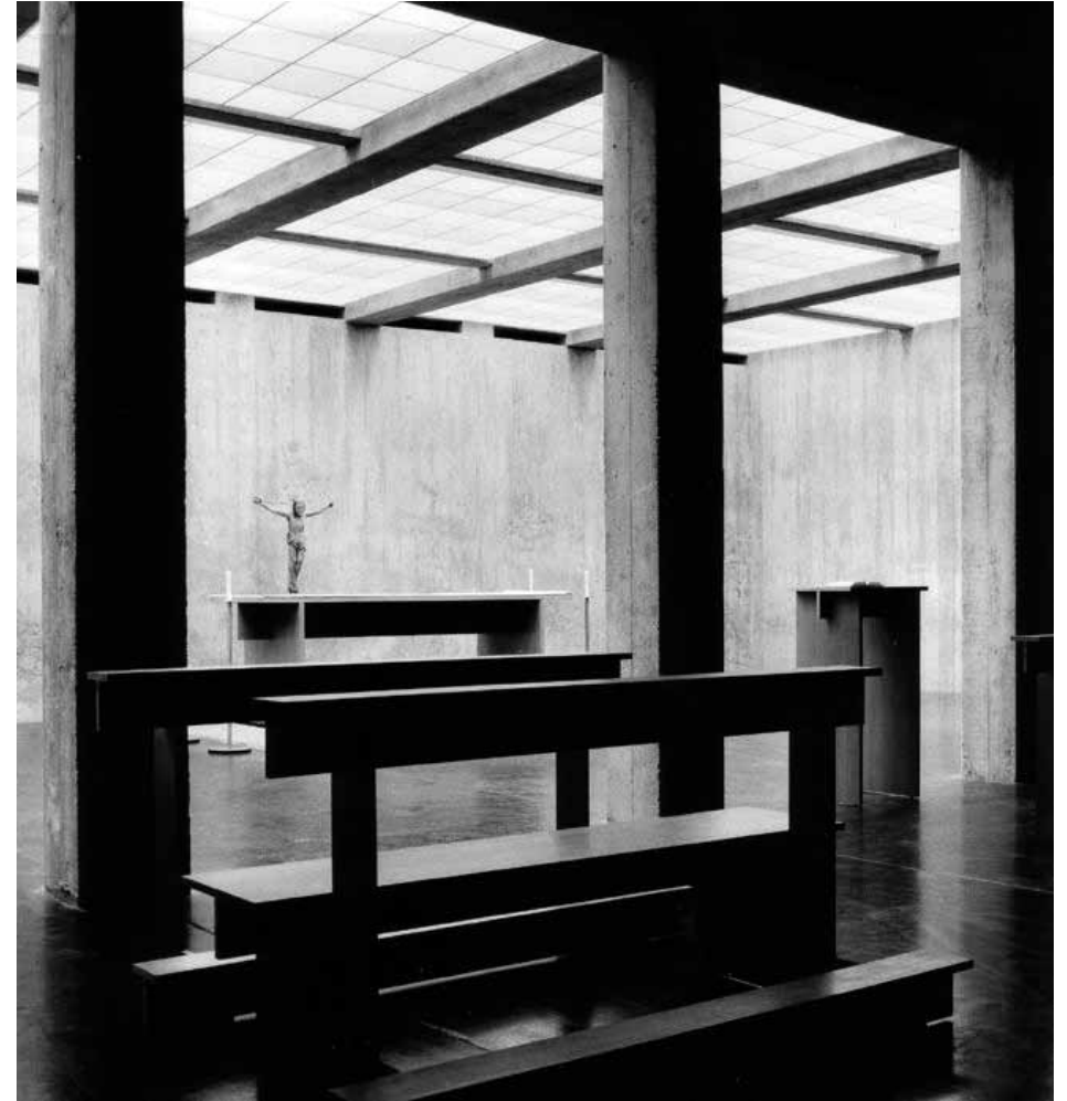
Abb. 2 Kapelle Peter Jordan-Straße, Wien 1961-63