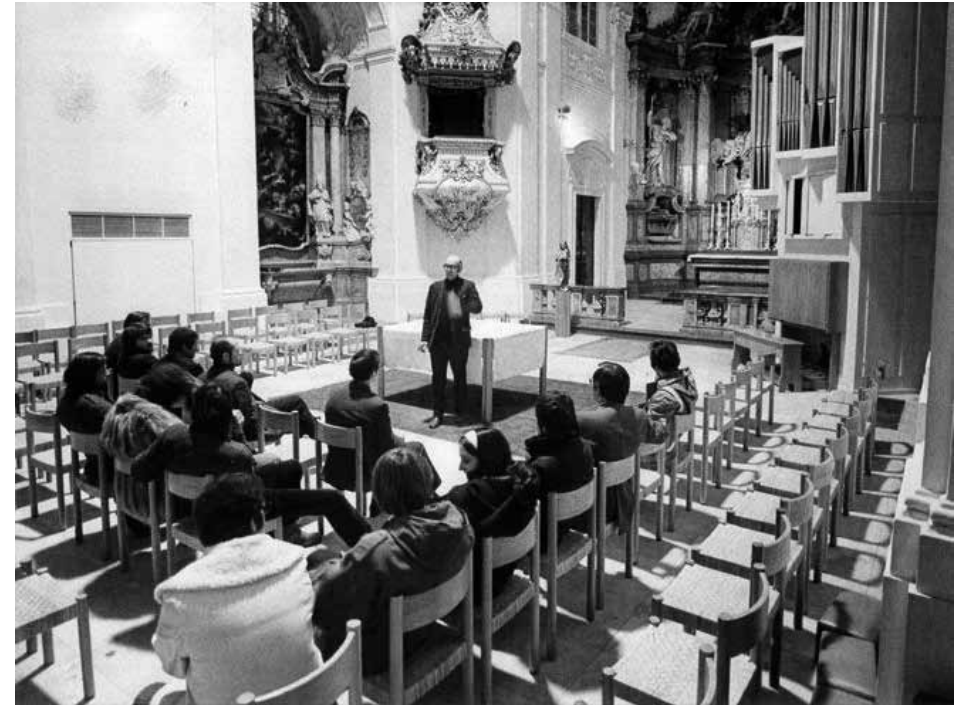
Abb. 5 – 6 Kirche Priesterseminar Boltzmannngasse, Wien 1969-70